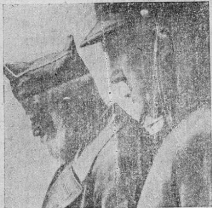
El General-Mija realiza una visita de inspección en los campos de batalla

Este corcho corresponde en su composición ampliamente al producto natural. Las materias nutritivas son extraídas con sencillez y empleadas para el alimento del ganado. En los ensayos hechos hasta la fecha, planchas elaboradas del nuevo corcho sintético demostraron ser de igual valor que el corcho natural.